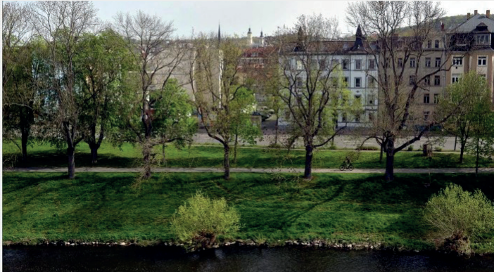
Schöne Aussichten vom Balkon über die Elster.