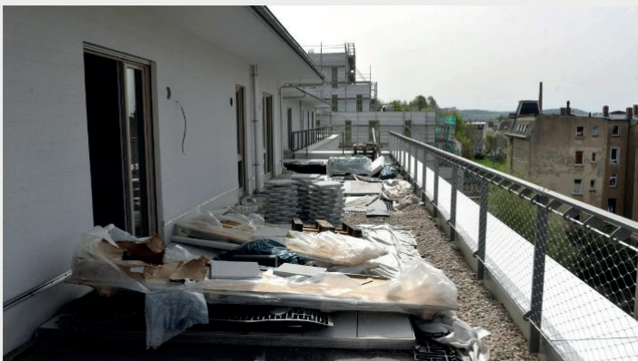
Dachterrassen im Obergeschoss