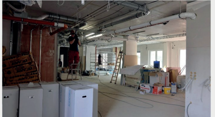
Blick in die Räume der künftigen Tagespflege im Erdgeschoss.