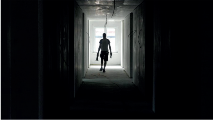
Baustelle altersgerechtes, barrierefreies Wohnen im Heinrichsquartier.