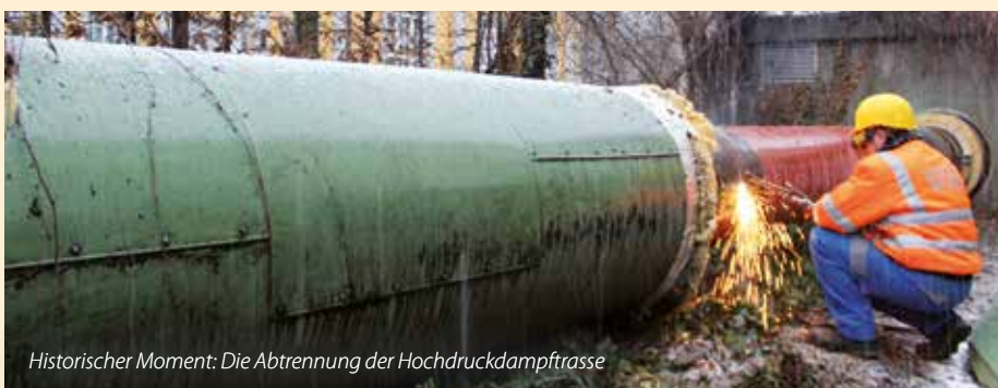
Historischer Moment: Die Abtrennung der Hochdruckdampftrasse