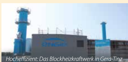
Hocheffizient: Das Blockheizkraftwerk in Gera-Tinz

Gleichzeitig bringt die EGG den nötigen Ausbau der Fernwärme-Netzstruktur voran. Damit einhergehend wird das bisher zum Teil dampfbetriebene Fernwärmenetz vollständig auf Heißwasser umgestellt und somit die Energieeffizienz erhöht. Für diese Maßnahmen investiert die EGG ca. 8 Mio. Euro. Die Bauarbeiten sind in vollem Gang und werden voraussichtlich bis Mitte 2019 andauern (vgl. S. 6).